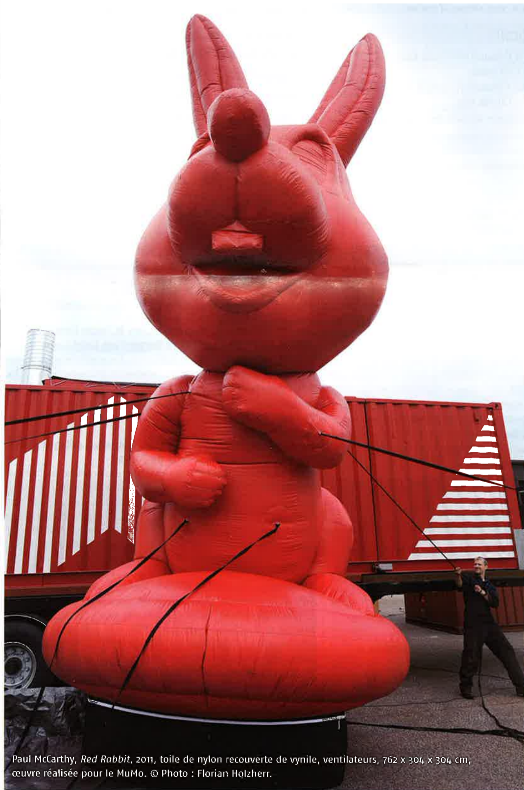
Paul McCarthy, Red Rabbit, 2011, toile de nylon recouverte de vynile, ventilateurs, 762 x 304 x 304 cm, œuvre réalisée pour le MuMo.

Tel un phare attirant irrémédiablement les enfants vers lui, ce Lapin rouge de Paul McCarthy trône sur le conteneur du « MuMo », un musée mobile conçu pour le jeune public ■ Qu'il s'effectue dans un cadre scolaire ou familial, l'éveil à l'émotion artistique et ses enjeux sont au cœur du dossier que le JdA consacre aux enfants dans les musées ■ Philosophe, universitaires et psychiatre livrent leurs réflexions sur la rencontre entre l'enfant et l'art.