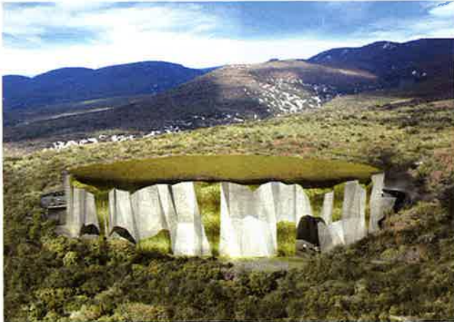
Projet pour le bâtiment qui accueillera la réplique de la grotte Chauvet-Pont-d'Arc. © illustration agence Fabre et Speller - Atelier 3A.

Tandis qu'un fac-similé de la cavité renfermant des chefs-d'œuvre de l'art pariétal est en construction, le ministère de la Culture va déposer sa candidature à l'inscription sur la Liste du patrimoine mondial